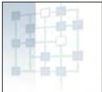
UNEV.dk - Universiteternes efter- og videreuddannelse - www.unev.dk