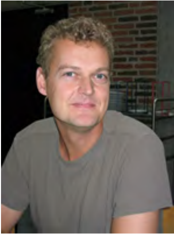
For Anders var det den netbaserede undervisning, der gjorde udslaget for hans studievalg

Klassens nestor lader forstå, at det er læringsdelen i pensum, der interesserer ham mest.