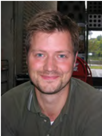
Peter ser net-undervisningen som en oplagt måde at komme tilbage i uddannelsesverdenen, samtidig med at man har et job.